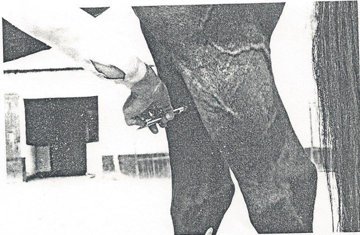
Injection de liquide sous pression au niveau d'un point d'acupuncture.

• Enfin les troubles psychiques devraient intéresser l'acupuncteur si l'on